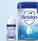
Bebilon PROFutura płyn Bebilon PROFutura CESARBIOTIK

Gdy dziecko przyszło na świat drogą cięcia cesarskiego