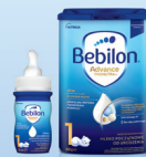
Bebilon Advance PRONUTRA płyn Bebilon Advance PRONUTRA

Gdy dziecko nie może być karmione piersią lub jest dokarmiane