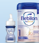
Bebilon PROFutura płyn Bebilon PROFutura DUOBOTIK

Gdy dziecko przyszło na świat drogą cięcia cesarskiego